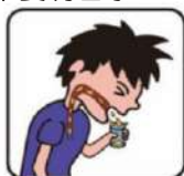
6.將肺部深處痰液咳入收集盒，不能收集唾液及喉頭分泌物