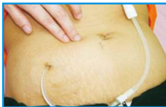
腹膜透析導管出口