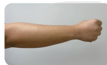
骨折處未收縮 (示意圖)

(2) 骨折處的部位：骨折後固定的患肢，也要嘗試在固定姿勢下做肌肉收縮的運動（如下圖），每小時至少做 10分鐘，避免關節過度黏連與肌肉萎縮。