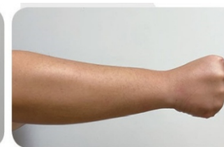
骨折處嘗試收縮 (示意圖)