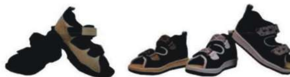
成人／兒童保健涼鞋