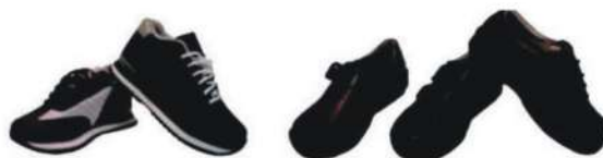
成人保健運動鞋／皮鞋